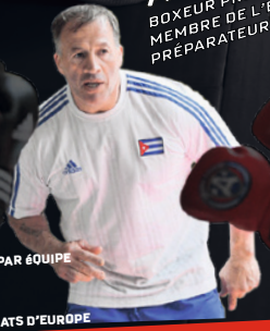
ALAIN VASTINE BOXEUR PROFESSIONNEL MEMBRE DE L'ÉQUIPE DE FRANCE PRÉPAREUR PHYSIQUE

5 FOIS CHAMPION DE FRANCE 1ÈRE DIVISION 4 FOIS CHAMPION DE FRANCE 1ÈRE DIVISION PAR ÉQUIPE 4 VICTOIRES EN GRAND CHEM MÉDAILLÉ OLYMPIQUE VAINQUEUR EUROPÉEN CUP PLUSIEURS FOIS MÉDAILLÉ AUX CHAMPIONNATS D'EUROPE