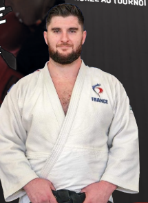
JOSEPH TERHEC MÉDAILLÉ D'OR A L'EUROPÉEN CUP SARAJEVO VICE-CHAMPION DE FRANCE 1ÈRE DIVISION MÉDAILLÉ DE BRONZE AU TOURNOI DE PARIS

5 FOIS CHAMPION DE FRANCE 1ÈRE DIVISION 4 FOIS CHAMPION DE FRANCE 1ÈRE DIVISION PAR ÉQUIPE 4 VICTOIRES EN GRAND CHELEM MÉDAILLÉ OLYMPIQUE VAINQUEUR EUROPÉEN CUP PLUSIEURS FOIS MÉDAILLÉ AUX CHAMPIONNATS D'EUROPE