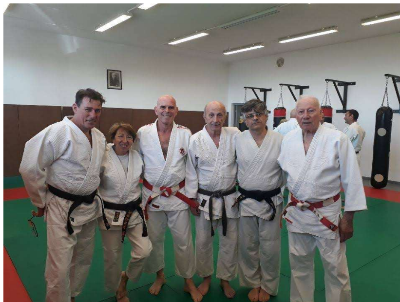
Photo du Stage Saison 2018 - 2019

Collège Léonard de Vinci Quartier La Colle Noire 83440 Montauroux